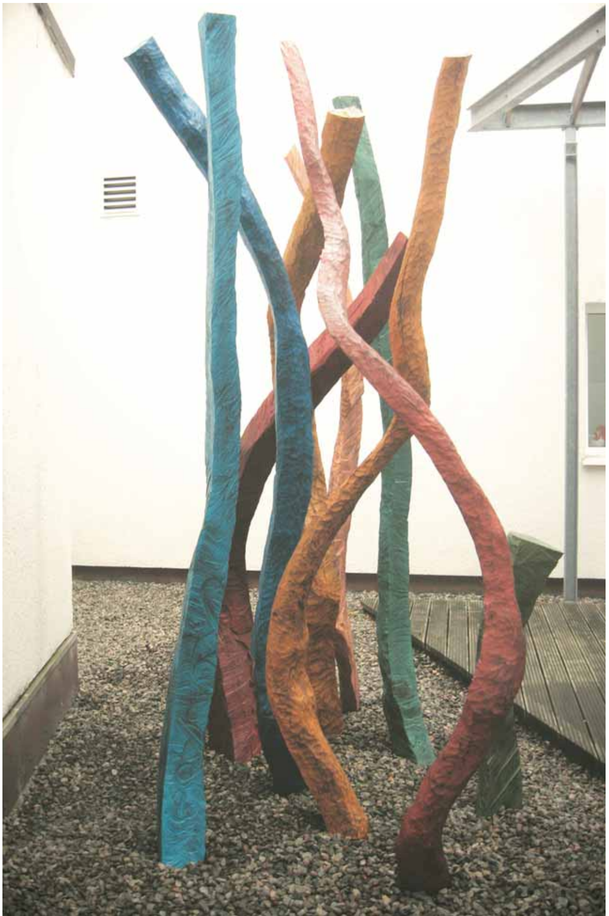
9teilige Skulptur für die Kreissparkasse Stade